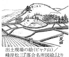
出土現場の絵(ビヤク山) / 峰岸松三『落合名所図会』より

木箱には「九千八百九拾五枚」という、かつての古銭の枚数が記され、箱の中には戦時中の供出時のものと思われる「八千八百八十八枚」の荷札が残