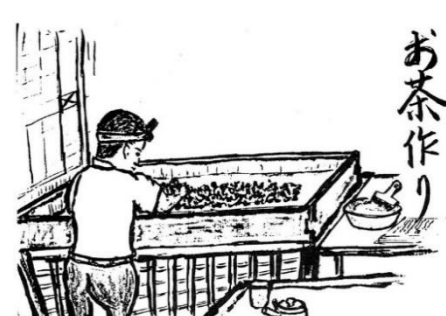
「今昔 暮らしぶり図絵」より

行われました。古くは各家庭で製茶していましたが、戦後は家々で集めた茶葉を昭島市にある製茶工場に送って製茶したそうです。(茶畑は現在の鶴牧西公園で見ることできます)