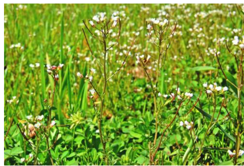
タネツケバナ