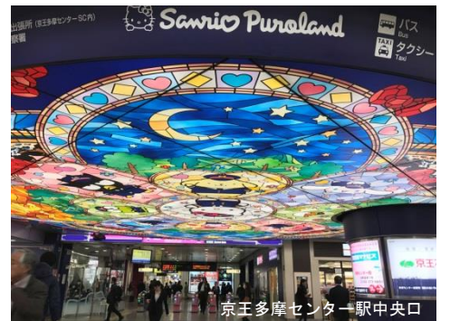
©13,18 SANRIO S/D・G ©76,88,90,93,96,01,09,18 SANRIO APPROVAL No.P1010053

によって駅が生まれ変わりました。駅に到着したときからサンリオの世界観を味わうことができ、わくわくドキドキした気持ちで駅をご利用いただける装飾となっています。駅の窓口では、キティ名誉駅長もお待ちしていますし、駅係員もハローキティのプレートをお客様をお迎えしています。駅をよく見てみると様々なところに隠れキャラクターを発見することができるので、楽しんでいただけたら幸いです。