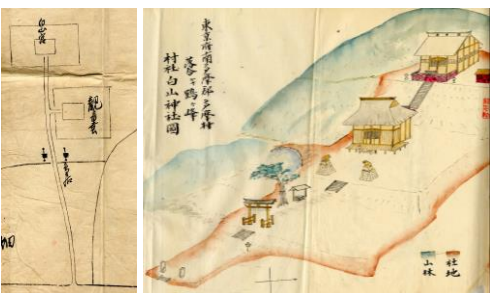
寛政2年絵図(部分) 大正3年 村社白山神社図

これには、明治43年(1910)の境内の建物移動が関係しています。多摩村内の神主を兼務した太田家の古文書には、境内の東側にあった「拝殿」を「本殿ニ対シ正式ノ位置」である境内中央に移動させたことが記されています。