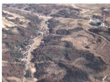
1976年、空からの唐木田・中沢(UR都市機構)