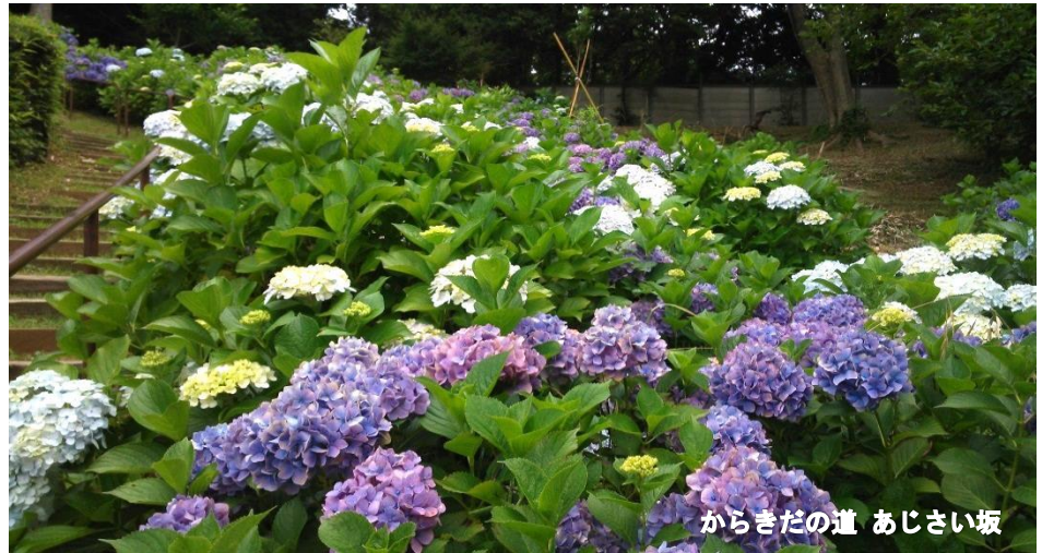
からきだの道 あじさい坂