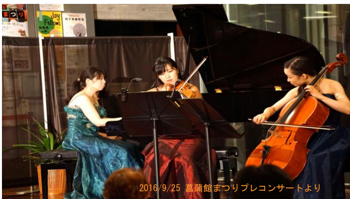
2016/9/25 菖蒲館まつりプレコンサートより