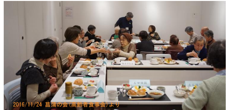
2016/11/24 菖蒲の会(高齢者食事会)より