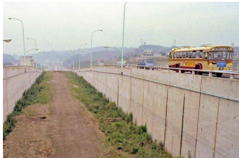
南大沢 内裏橋付近を走る多25系統の神奈川バス 昭和58年(1983)

バスの車内で配布されていた『京王バス南沿線おでかけ情報板第37号』を参考にさせていただきましたが、そこに掲載されている1980年代のバス路線図を見ていて興味深いことに気づきました。一つは、桜44系統が下小山田行き、桜43系統が国際ゴルフ場行きとして載っていることです。これで、少なくとも多摩センター駅開業後の1980年代に聖蹟桜ヶ丘駅と唐木田地区を結ぶ路線が残っていたことがわかりました。そしてもう一つは唐木田地区のバス停です。