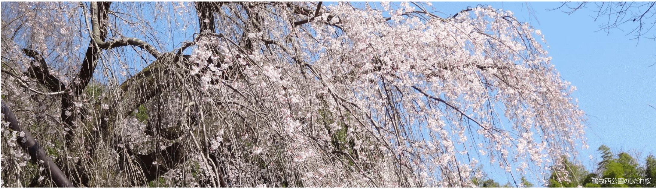
鶴牧西公園のしだれ桜