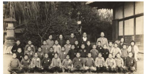
吉祥院に疎開した子どもたち 昭和19年(1944) 『街から子どもがやってきた』より

子どもたちは昭和19年8月14日、大井町駅を出て聖蹟桜ヶ丘駅に到着し、徒歩で学寮に向かいました。学童のひとり、当時の様子を「駅前一面田んぼ。(中略)バスもなく駅より歩いて歩いて乞田の吉祥院まで来た覚えがあります。周辺は田んぼ、畑、竹藪で大変な処へ来たと思いました」と回想しています。聖蹟桜ヶ丘駅から学寮に向かう途中、多摩国民学校(現・多摩市役所の地)で麦茶とトマトの歓待を受け