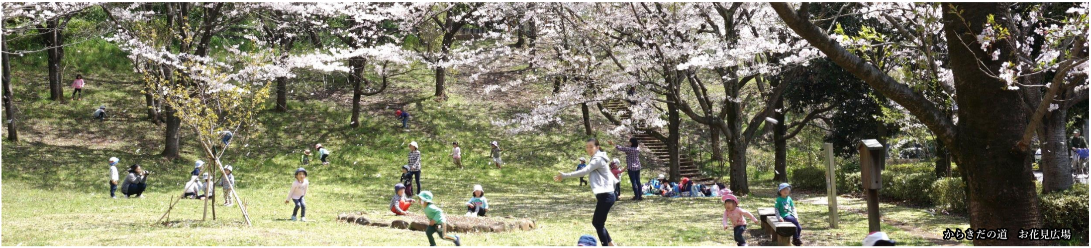
からきだの道 お花見広場