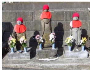
貝取神社にある大橋の地蔵

の境界でもありました。かつて大橋のそばには森久保商店が店を構え、桑市を開催するなどしてにぎわっていたそうです。また、大橋のそばには3体の地蔵が祀られており、「鬼門除けの地蔵」として信仰されていました。嫁入り行列はここを通ることを避け、別の道から入る習俗があったと伝えられています。