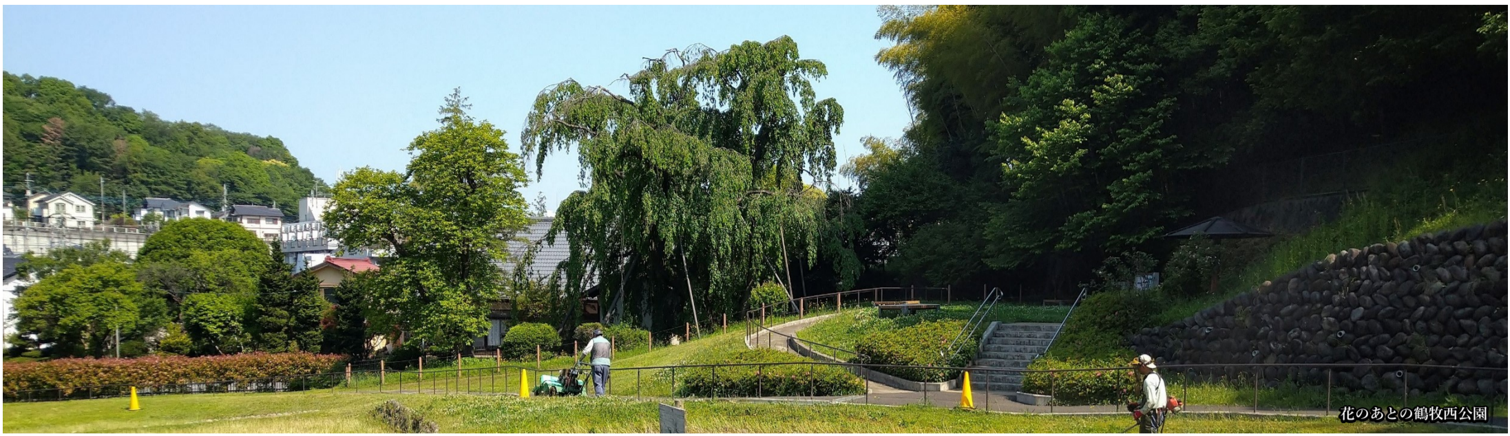
花のあとの鶴牧西公園