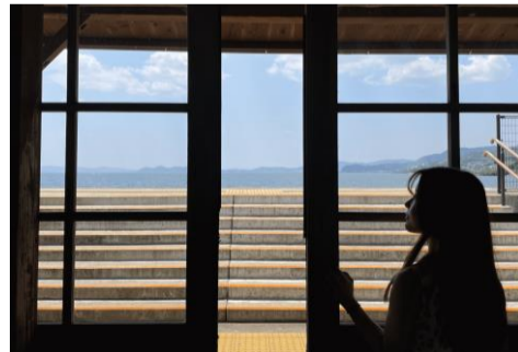
海が見える駅の旅、千綿駅にて(長崎県)

感覚に頼りすぎると何も浮かばない時期も増えてしまうけれど、それでも作曲の中で一番大切にしているのは「直感」で、そこから来る新鮮さや勢いはその時にしか絶対に出せないものだったりし、後から「こんな曲は二度と書けない!」と思えることも。その