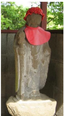
山王下の岩船地蔵