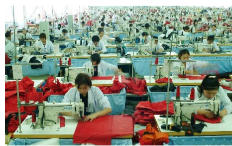
海外の縫製工場で活躍する JUKI の工業用ミシン

JUKI の工業用ミシンは、ジーンズ用、ボタン付け用などの用途が決まった専用機、複数の縫製工程を自動で行う自動機など、約2,000機種を品揃え