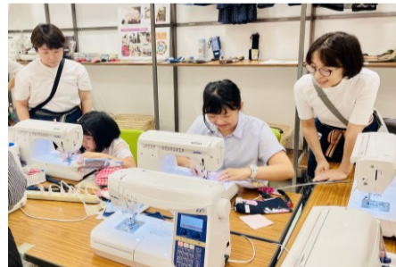
昨年6月に聖蹟桜ヶ丘オーバで開催したアップサイクルのワークショップ

4回にわたって本広報紙に寄稿させていただき、今回が最終回となりました。「縫い目」のあるモノを見たときに当社のことを思い出してくださると嬉しいです。また、着なくなった服や布製品を破棄する前に「アップサイクルできないか？」と自然環境を考えるきっかけになれば幸いです。これからも皆さまの日常と地球環境が豊かでサステナブルでありますように。(丁)