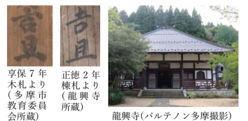
享保7年木札より(多摩市教育委員会所蔵)