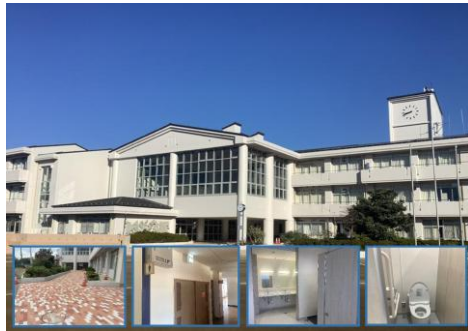
(上：工事の終了した校舎 下：校舎周り、トイレの様子)

先日行われた音楽祭では、プログラムの最後に全校生徒で校歌を合唱しました。全学年での合唱がパルテノン多摩の大ホール一杯に響きわたる様子は、感動的な光景でした。伝統を受け継ぎながら、次につないでいくことは、学校に課せられた大切な使命の一つであるとの認識に立ち、私たちは日々の教育活動に当たっております。